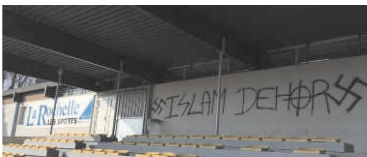
Tag islamophobe dans un stade de la Rochelle

C'est ainsi qu'on a vu être votées les lois sur les signes religieux « ostensibles » à l'école (2004) puis sur le voile intégral dans l'espace public (2010).