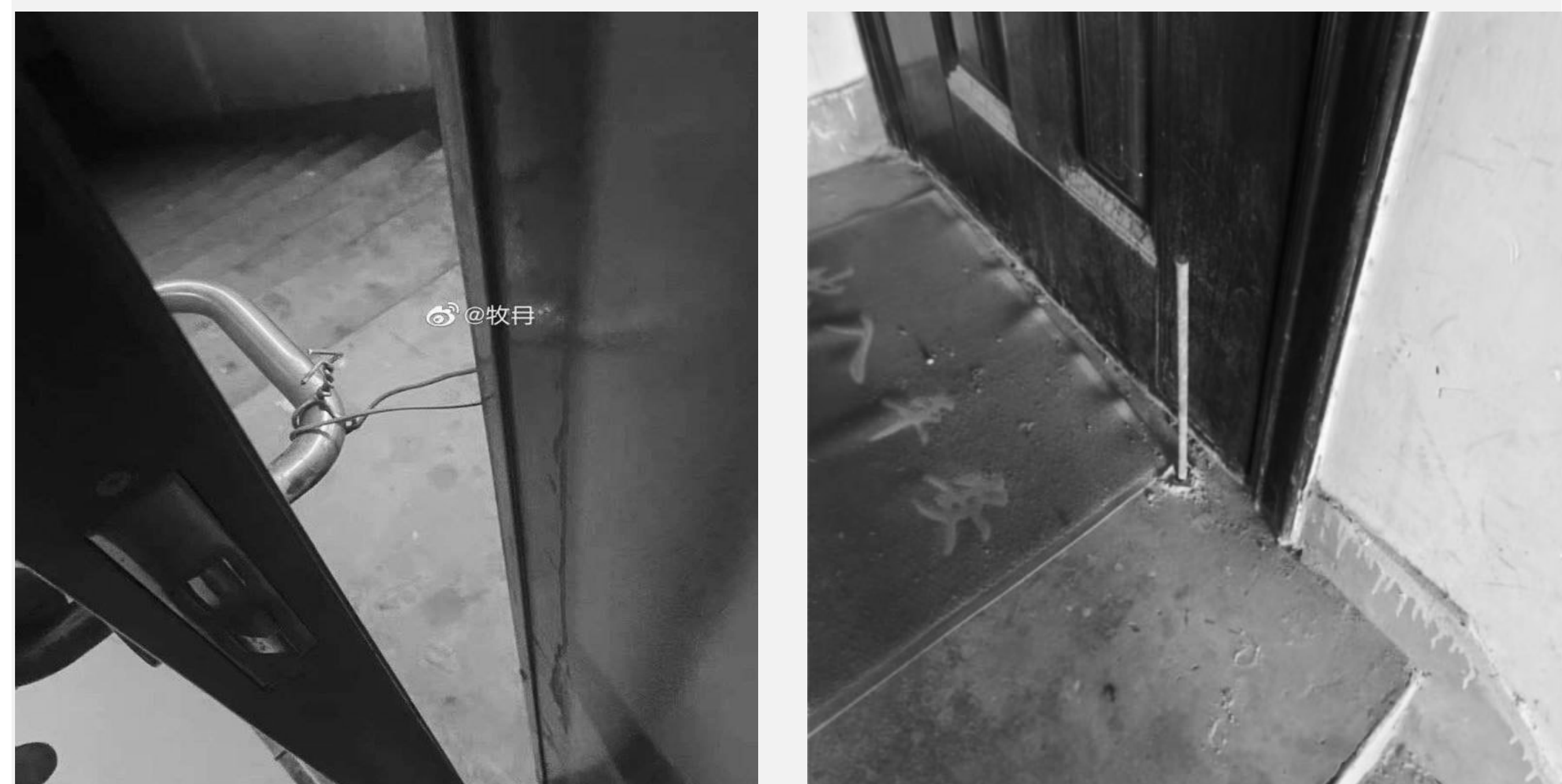
(Fils et barres bloquant les portes des habitant.es)